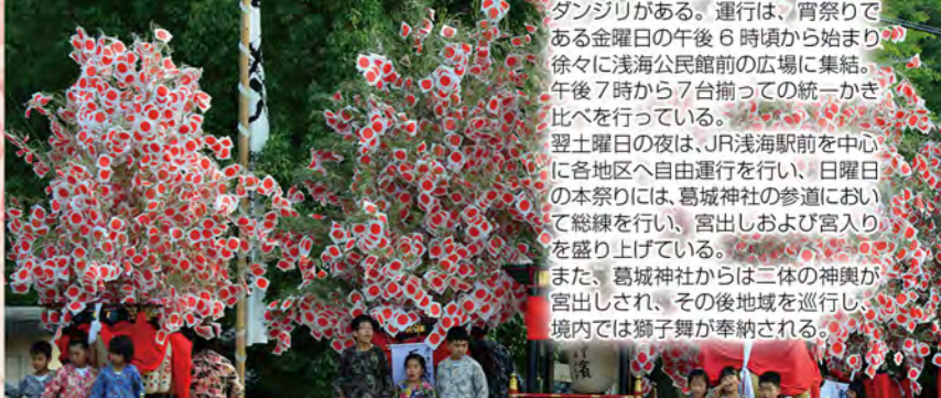
浅海校区エリアの見どころ⑦

浅海校区には、本谷・小竹・真沖・真沖浜・原・原浜・味栗の7地区にダンジリがある。運行は、宵祭りである金曜日の午後6時頃から始まり、徐々に浅海公民館前の広場に集結。午後7時から7台揃っての統一かき比べを行っている。翌土曜日の夜は、JR浅海駅前を中心に各地区へ自由運行を行い、日曜日の本祭りには、葛城神社の参道において総練を行い、宮出しおよび宮入りを盛り上げている。また、葛城神社からは二体の神輿が宮出しされ、その後地域を巡行し、境内では獅子舞が奉納される。