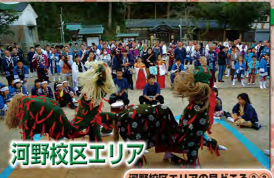
河野校区エリアの見どころ②③

河野校区には、宮内・別府・府中・柳原・片山・中須賀・中須賀団地・夏目・佐古・善応寺の10地区にだんじりがある。地区によっては、子どもだんじりと大人だんじりがある。宵祭りの河野屋台総練(パルティエフジ夏目店駐車場)は、広い駐車場で壮観かつ幻想的で圧巻の見応えである。ギャラリースペースも十分あり、ぜひ立ち寄りた。本祭りでは、高縄神社にて、早朝に神事とともに全地区の代表担ぎ手によって大神輿を厳かに宮出しし、河野全地区へ渡御を開始する。その際、馬場でのだんじりと神輿の掛け合いが見応えある。境内では、善応寺獅子舞保存会の獅子舞・狐等の奉納も同時に行われる。その後、だんじりは河野保育園前に場所を移し、総練りを行う。宮出・宮入りに行われるこれらの運行は、河野校区の秋祭りの醍醐味である。担ぎ手とともに味わっていただきたいものである。