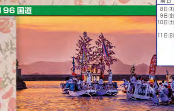
北条校区エリアの見どころ④

北条校区は、総勢20体の屋台があり、その台数もさることながら、練中の熱気は一際目立つものがある。北条校区の鹿島神社の宮出しは、早朝5時より順に渡御され、一日渡御した御神輿は「清めの意味」を込めて、また鹿島神社の主祭神(武甕槌神)が武神であり、荒々しさを望むため、川に何度も何度も放り込む。これを「禊ぎ神輿」と呼び、氏子・観客共にその姿に魅了され、この行事の始まりを楽しみに、そして終わりを名残惜しんでいる。禊ぎを終えた御神輿は北条沖に浮かぶ鹿島に宮入りするが、御神輿を乗せた御舟を導き、先導するのが河野水軍由来の権練りである。戦勝祈願や祝いのために奉納される勇壮な舞は、愛媛県無形民俗文化財に指定されている。