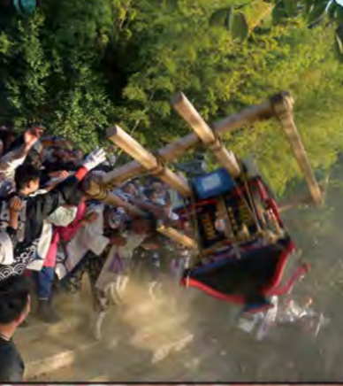
【危険行為撮影の禁止について】

◎危険な撮影行為による、警察への苦情や通報事案はもとより、神社等会場責任者や警備に当たる警察官・現場頭取等から安全確保の為、立ち退きや、即刻撮影禁止を求められた場合は、ただちに指示に従って下さい。指示に従わない場合は選外失格とします。