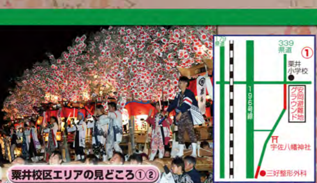
栗井校区エリアの見どころ①②

栗井校区では、栗井地区屋台実行委員会が中心となり、屋台の運行を行っている。安岡避難地では統一練りが行われ、提灯の燈った横一線の屋台は幻想的。宇佐八幡神社では、庚申車の宮出しを迎えるため馬場で練りを行う。素担きで階段を駆け上がる屋台もあり見応えがある。その後、三好整形外科前で、獅子舞と屋台の練りが行われる。JR栗井駅前では、当年最後の練りが行われ、観客も手を伸ばすと屋台に触れるほど接近し、担ぎ手と一体感が生まれる。最終日、各神社では神輿の宮出し(小祭)が行われ、各区を渡御し、夕刻の宮入りで秋祭りが終わる。